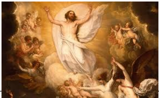
Ի՞նչ է շարժվում բանը ըստ սուրբ Սուրբի:

Զատիկ բառը ունի բազմաթիվ բացատրություններ: Ոմանք մամուռի և կր գտնեն Երբայեցիներու Պասեֆին (Passover) հետ: Պասեֆ կը նշանակէ ելք: Հրեաներու ամենամեծ ու յարգուած տօներէն մէկն է Պասեֆը: Անոնք կը յիշատակեն Եգիպտոսի ծանր լուծէն իրենց ազատիլն ու ելքը: Իսկ մենք՝ Քրիստոնեաներս, Յիսուսի չարչարանքի արդիւնքով հրաշափառ Յարութեամբ կը յիշատակենք մարդկութեան մահուան իշխանութենէն ու սատանայի ծառայութենէն դուրս գալը եւ երկնքի արքայութեան արժանի դառնալը: Յիսուսի կեանքին վերջին դրուագները տեղի ունեցան հրեաներու Պասեֆի տօնին: